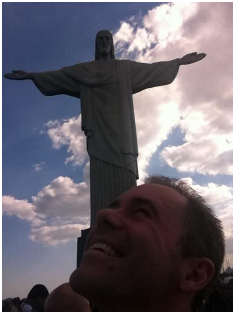
Kristus er stor, ja han er sandelig stor, også i Rio